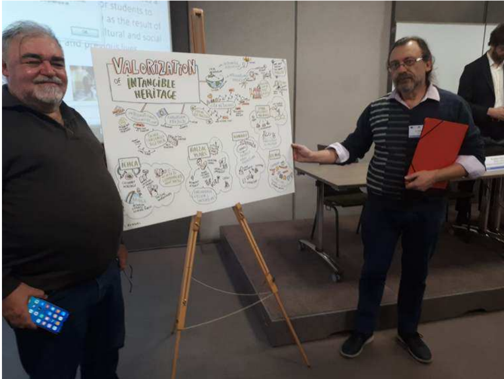
EVENTO TRANSNACIONAL TOURS- FEBRERO 2020