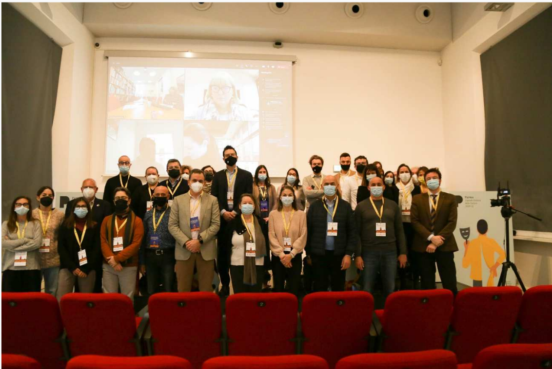
EVENTO TRANSNACIONAL PARMA- DICIEMBRE 2021