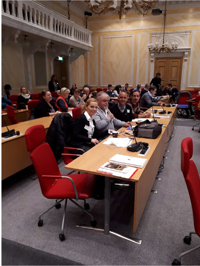
EVENTO TRANSNACIONAL LINKÖPING – OCTUBRE 2019