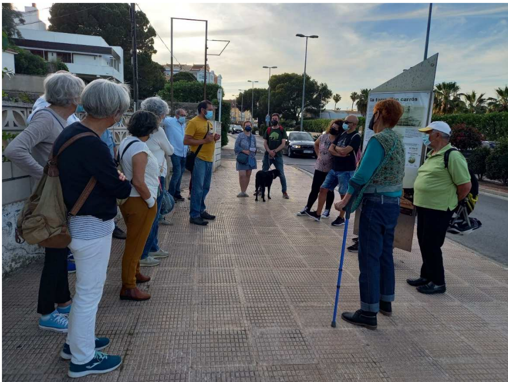
VISITA GUIADA: EL FORTÍ-MADINA DANIYA 12/05/2021