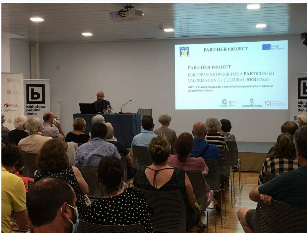
EVENTO LOCAL DÉNIA 16/06/2021